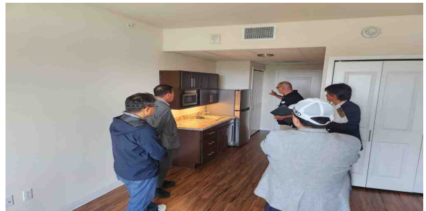
시설견학 및 질의응답