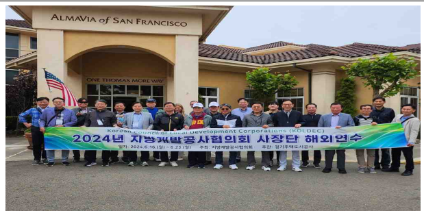
Almavia of San Francisco 방문