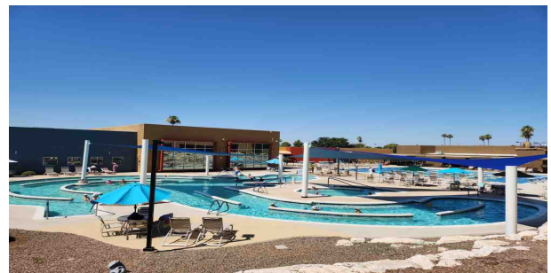
SUNCITY의 다양한 편의시설