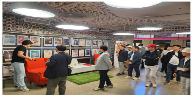
시설견학 및 질의응답