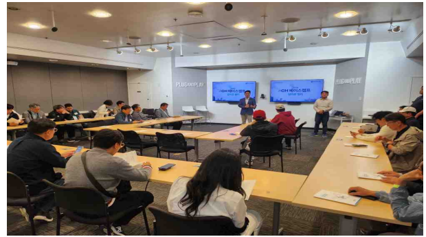
Plug and Play 본사 방문