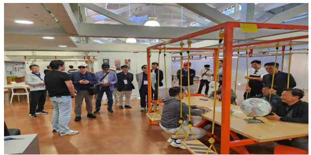
스탠포드 D스쿨 탐방