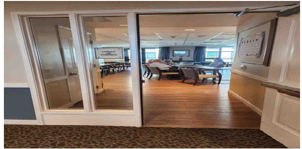
UC버클리 UBRC 방문